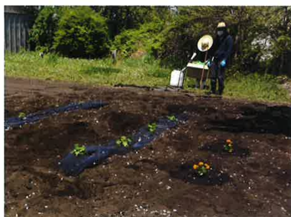
↑皆で協力をして苗を植え付けました

暑い日の作業もありますが、交代で協力をして作業をしています。一緒に植えたサツマイモと落花生もゆっくりと成長しています。秋の収穫が今から楽しみです。