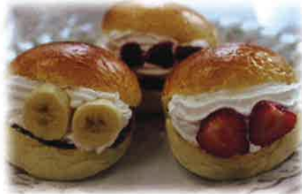
イチゴ、バナナブルーベリーの マリトッツォ