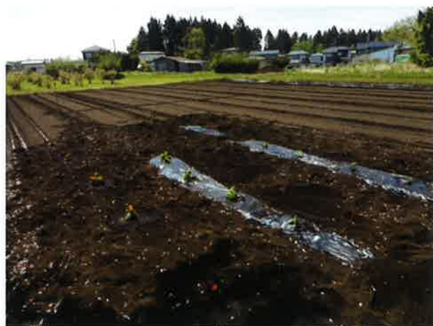
↑苗を植えた後の様子