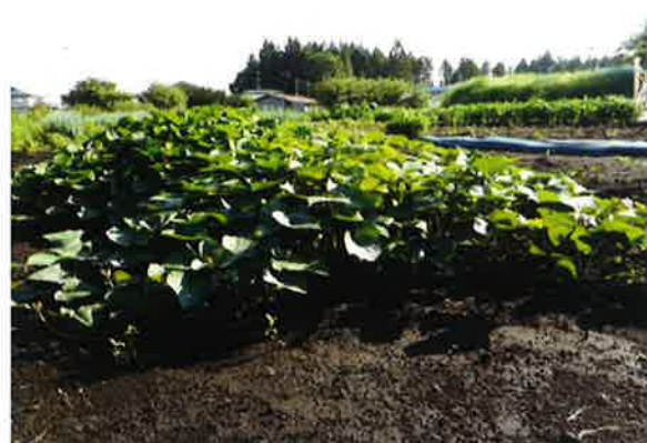
↑おいしいサツマイモができますように