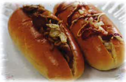
焼きそばパン、ホットドッグ

「そろそろ《GO TO OT イベント》やりませんか?」との要望があり、カフェレストラン茶居花の協力を得て6月8日(水)『第2弾パン祭り』を開催しました。