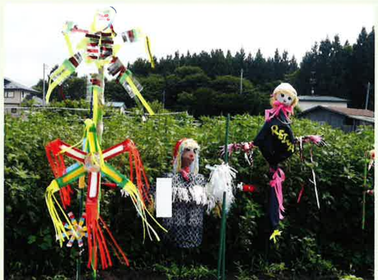
↑カラスの襲撃から畑を守るカかし隊

また、今年にはカラス対策としてペットボトルの風車と手作りのかかしを設置しました。