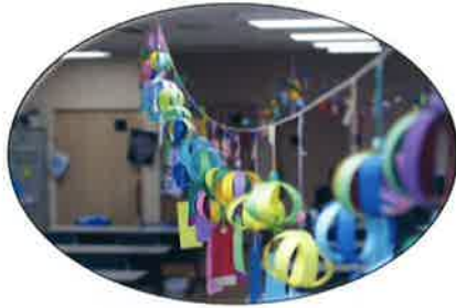
風鈴の下にそれぞれの願いが...