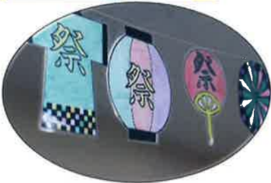
塗り絵の時間に1人1枚 塗りました

2021年7月21日(水)、作業療法室前駐車場で「七夕祭り」が開催されました。昨年同様、3密を避けるために病棟ごとに行いました。30度を超す真夏日でしたが久しぶりの行事に、皆喜んでいました。作業療法室内の風鈴飾りやうちわ型の飾りは、作業療法の時間に患者さんたちが作りました。