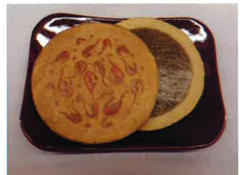
お皿に乗せてみました。