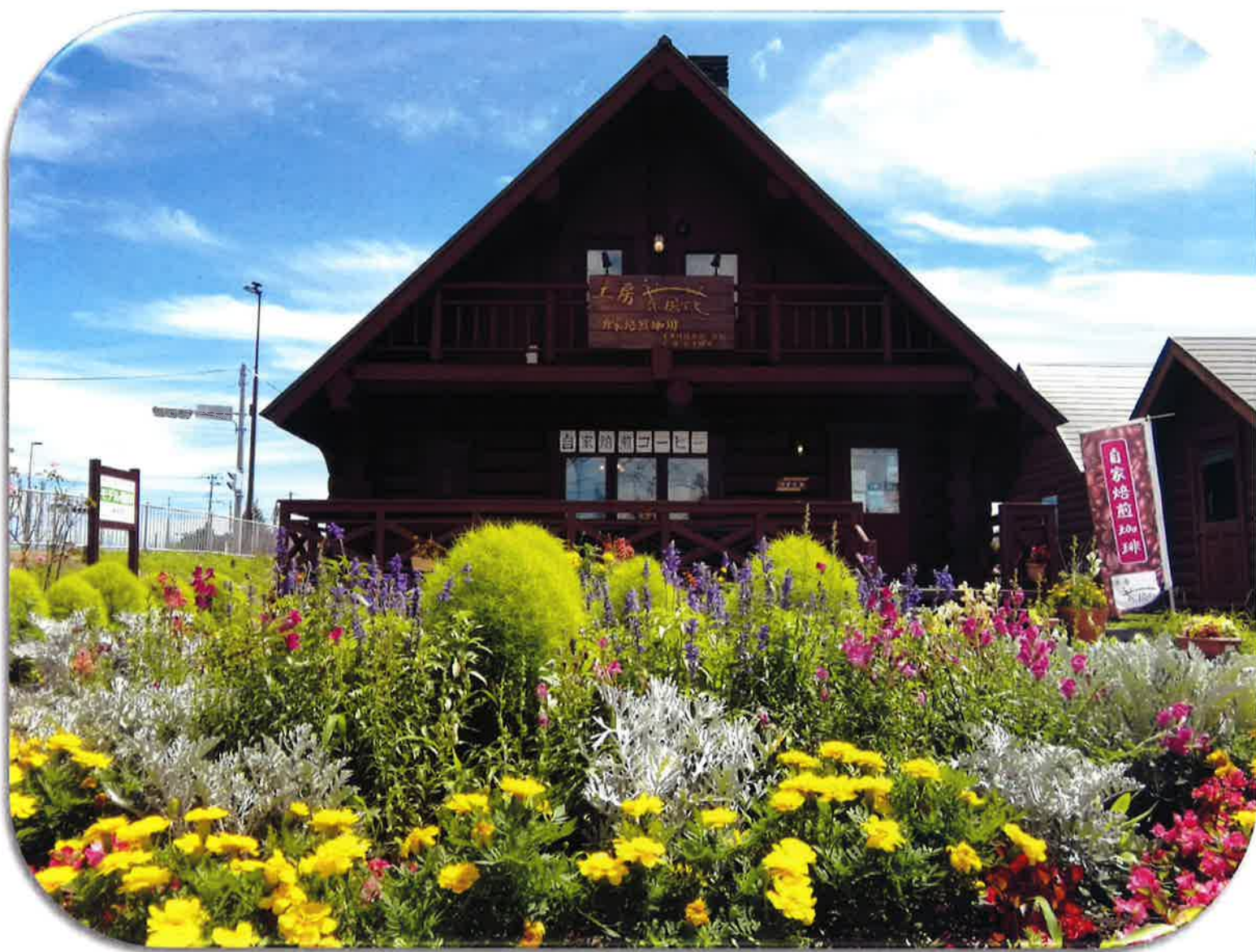
工房茶居花 珈琲館の花壇