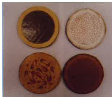
4種類の南部せんべいめんこ