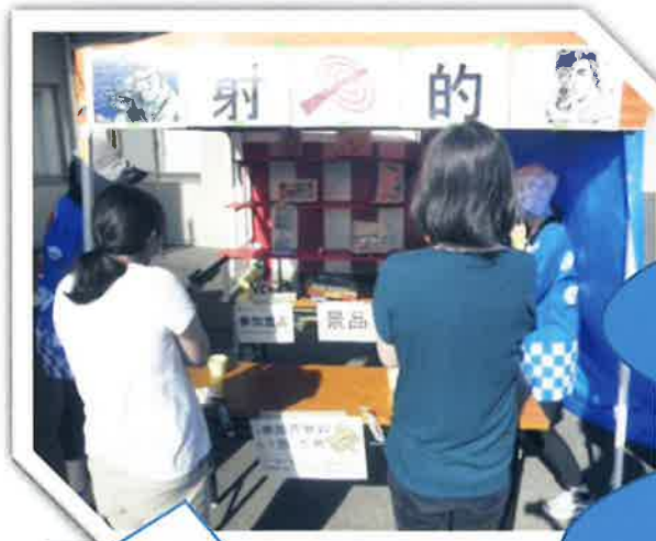
射的コーナー 当たらなくても景品GET!