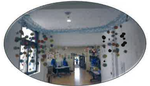
会場の飾りは患者さんたちと 手作り