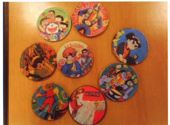
キャラが懐かしすぎます!