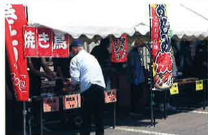
人気の「焼きそば」 「お好み焼き」「たこ焼き」