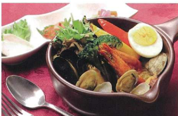
シーフードといろいろ野菜のスープカレー

セット内容 ・鶏菜 ・ライス or パン ・ポットドリンク ・ミニソフトクリーム 2,000円