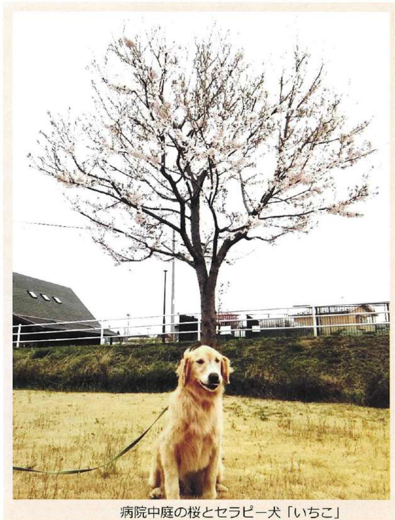
病院中庭の桜とセラピー犬「いちこ」

P2…一人暮らし応援隊（外来・訪問看護課） / 家族のサポートグループ（心理課）