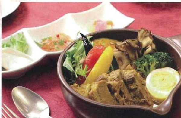
牛バラ肉といろいろ野菜のスープカレー