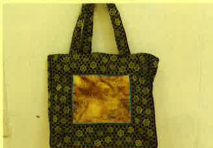
畳の縁を利用したバッグ