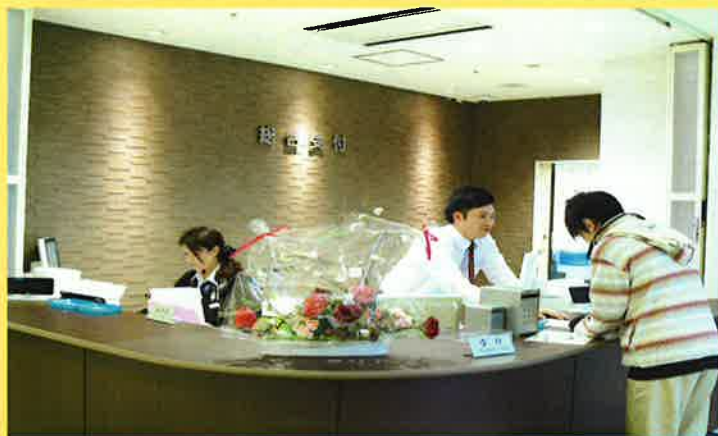
外来診療費・入院費の精算の窓口

院内は全館禁煙で青森県から「空気クリーン施設」の認定を受けており、受動喫煙を防止し、安心してご利用いただけます。