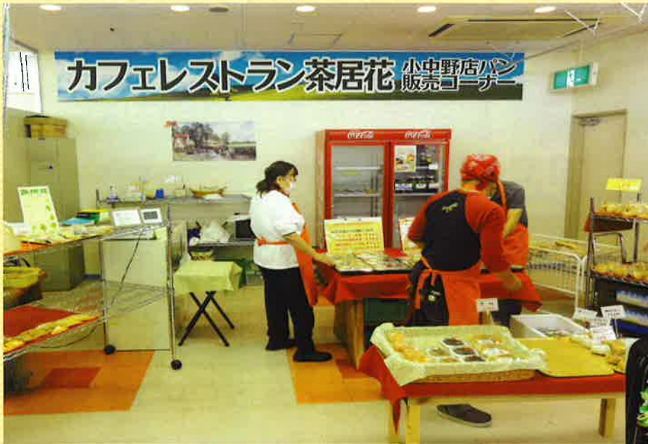
茶居花小中野店内もリニューアルしました

調理や販売は利用者さんと職員とで取り組んでおり、これからもより多くのお客さまにご利用いただきたいと思っています。