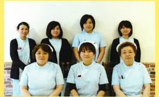
明るい雰囲気の外來スタッフ

外来看護師はベテランナースから20代のフレッシュなスタッフまで幅広い年齢層のスタッフが勤務していますが、優しい心もち、聞き上手なスタッフが揃っています。