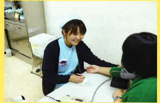
看護師がお一人ずつお話を うかがいます