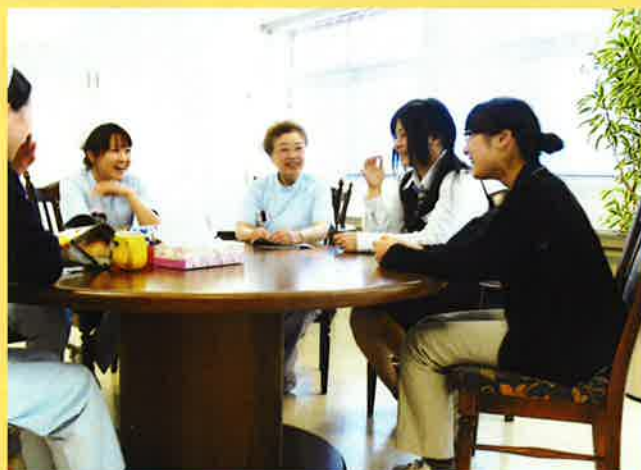
職員の休憩コーナー

新病院では外来診療にかかわる部署が一箇所に集約され、多職種間での情報をこれまで以上に共有出来るようになりました。来院されてから診療を終え、お薬をお渡しするまでの時間を短縮することや相談ごとは担当部署にコーディネートして振り分けられるようにするなど外来診療の運営が改善されつつあります。建物だけではなく、スタッフが提供するサービスについても見直しを図っているところです。