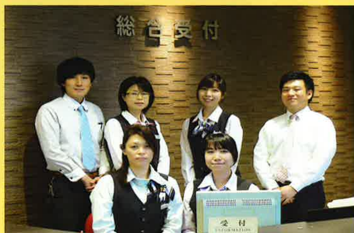
笑顔でお迎えいたします