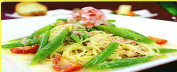
ズワイガニ と夏野菜 の 冷製カツペリーニ 1,800円