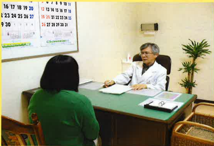
診察室での一場面 落ち着きやわらかな空間です

病院の理念でもある「人間の尊厳と人間愛に基づく医療を目指す」をモットーに、診療介助や相談業務を実施し、更に他部門と情報交換を行うことで、より適切な看護サービスの提供を心がけています。