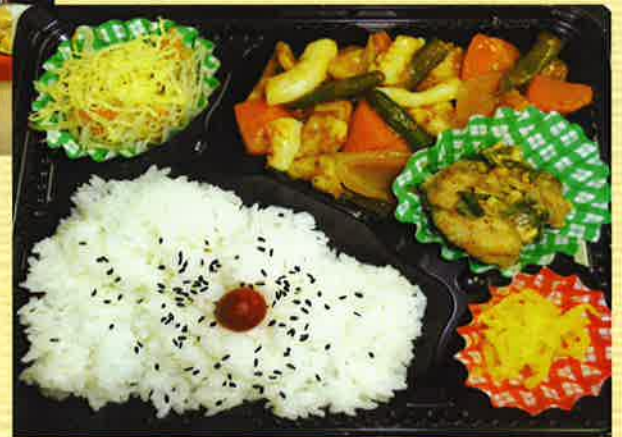
野菜たっぷり弁当はちょっとピリ辛の「四川風」となっています