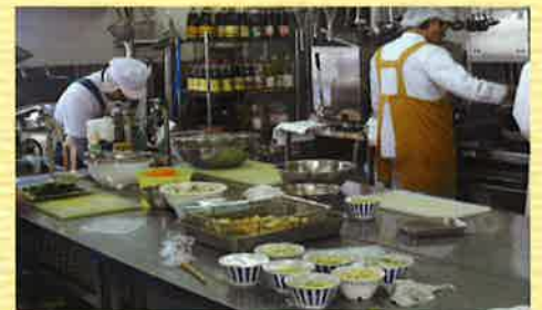
利用者さんも一緒に調理や盛り付けを行っています