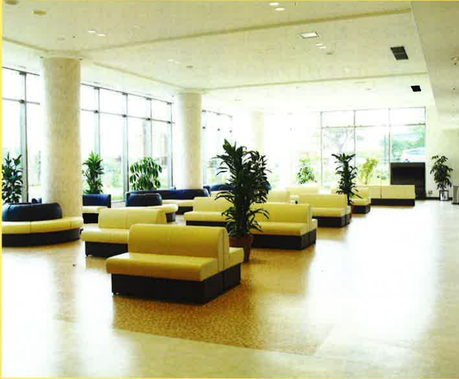
外来待合室は光と緑にあふれ広々とした作りです