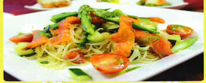
スモークサーモン と夏野菜 の 冷製カツペリーニ 1,800円