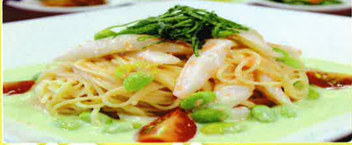
明太子 とイカの 冷製カツペリーニ (枝豆のクリームスープ仕立て) 1,800円