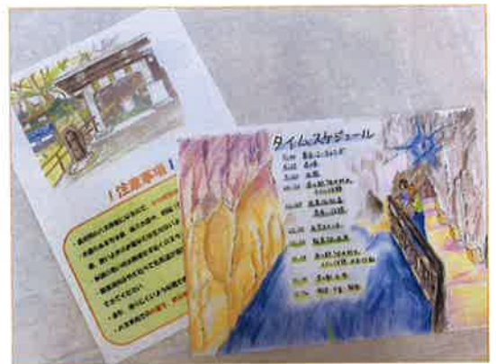
メンバーさんがきれいなしおりを作ってくれました