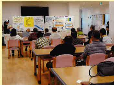
デイケアでの勉強会の様子

ックで勉強会も開きました。外来ホールにパンフレットなど用意してありますので、ぜひお手に取ってご覧ください。詳しくは、外来看護師までお気軽に声をかけてください。電話相談も受け付けております。