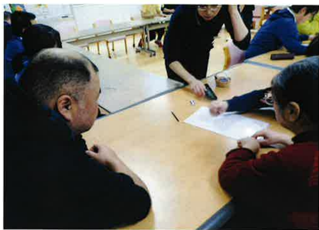
↑参加メンバーで役割分担をして、イベントの内容を考えたり会場準備を行いました。

デイケアで行っている健康増進プログラムが3周年を迎え参加メンバーで記念のイベントを行いました。カーリングのゲームや健康に関するクイズを行い、今までプログラム内で学んだことやメンバーが調べて発表してくれたことをもとに出題されました。難しいものもありましたが、ほとんど間違えずに答えていました。最後は代表2名の方に3年間を振り返って感想を発表してもらいました。他メンバーと協力をしながらいろいろなイベントを行ってきた思い出を振り返り、楽しい時間を過ごすことができました。