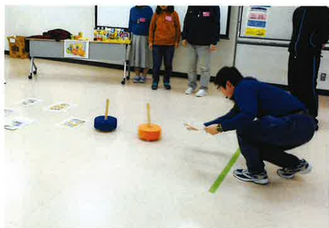
↑レクのカーリングの進行も担当のメンバーが行い、皆で盛り上がりました。