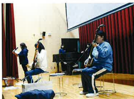
↑演奏の間の紹介のアナウンスも練習をしています。当日参加できない方の演奏は動画で紹介します。

春祭り本番では緊張しながらも、皆で息を合わせて発表をしました。発表を見ていたメンバーからは「とても良かった」と褒められていました。