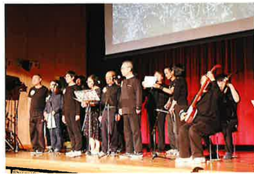
↑春祭り本番の様子です。緊張しながらも練習の成果を披露しました。