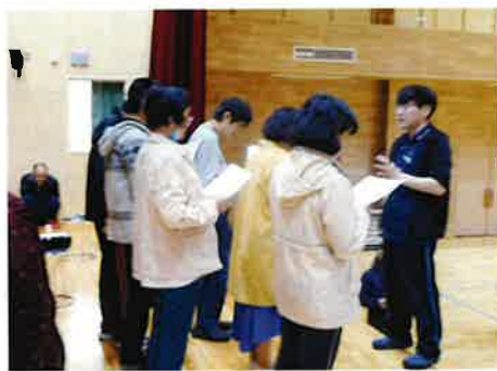
↑生演奏に合わせて合唱の練習をしている様子です。初めての発表に緊張感があります。