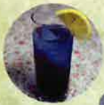
ドリンク ランチ用ドリンクから お選びいただけます。