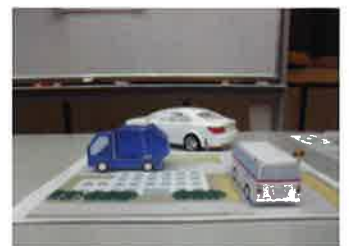
ペーパークラフト