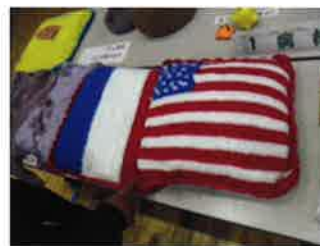
手編みのクッションカバー