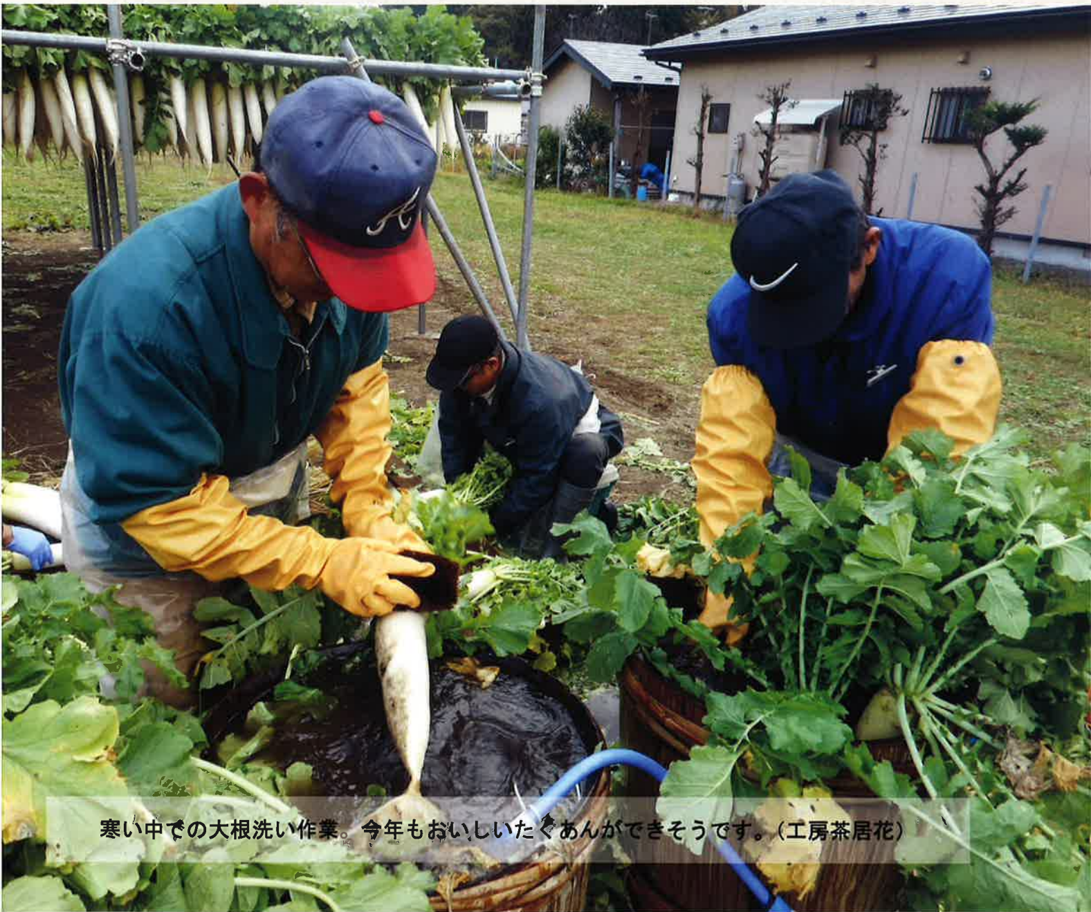
寒い中での大根洗い作業。今年もおいしいたくあんができそうです。(工房茶居花)